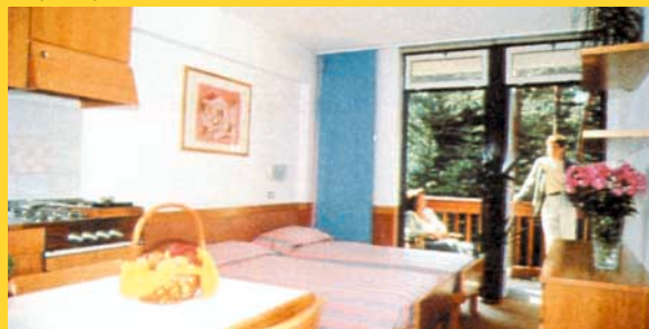
▲ RESIDENCE CORTE