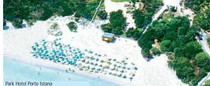
Park Hotel Porto Istana