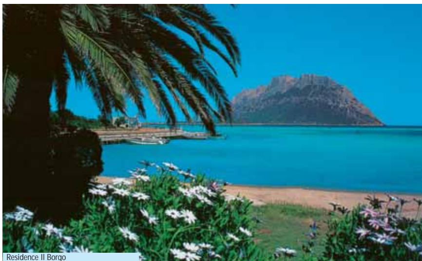
Residence Il Borgo

► OFFERTE SPECIALI (non applicabili in presenza di 3/4° letto): PRIMO PREZZO: pensione completa al prezzo della mezza pensione per prenotazioni confermate entro il 30/4 in tutti i periodi. VACANZA LUNGA: pensione completa al prezzo della mezza pensione per soggiorni di almeno 2 settimane escluso periodo F; SPOSI E ANNI D'ARGENTO (coppie over 60): pensione completa al prezzo della mezza pensione per soggiorni di almeno 1 settimana escluso periodo F.