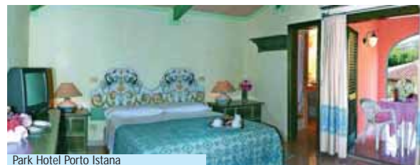
Park Hotel Porto Istana