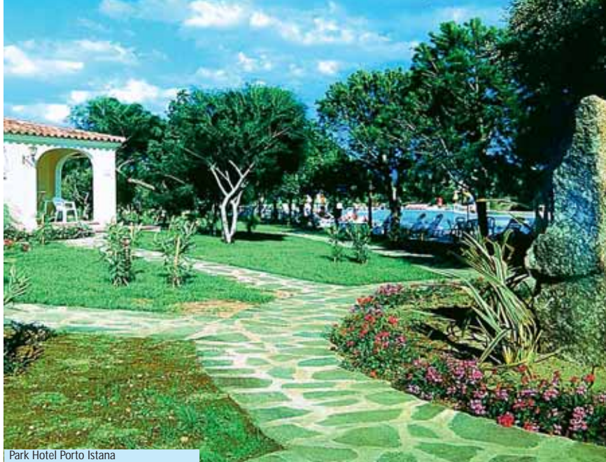
Park Hotel Porto Istana