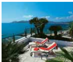
Hotel Sofitel Le Méditerranée

► OFFERTE SPECIALI GIORNI GRATUITI: 5=4, 5 giorni al prezzo di 4 in pernottamento e prima colazione in tutti i periodi escluso agosto.