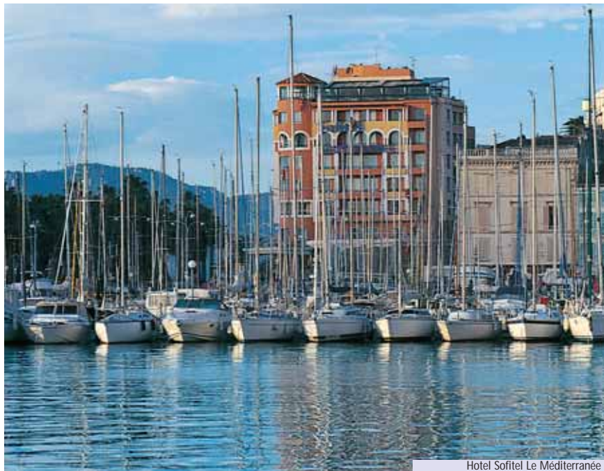
Hotel Sofitel Le Méditerranée