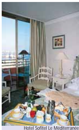
Hotel Sofitel Le Méditerranée

Servizi: reception 24h su 24, 3 ristoranti, 2 bar, garage su richiesta, 11 sale riunioni, sala affari, Carlton Health Club.