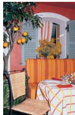
Hotel Sofitel Le Méditerranée

Sistemazione: dispone di camere insonorizzate, dotate di aria condizionata, telefono, radio, Tv sat, mini bar, cas-