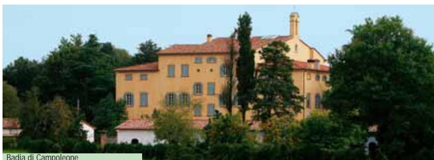
Badia di Campoleone