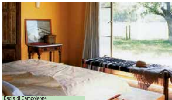
Badia di Campoleone