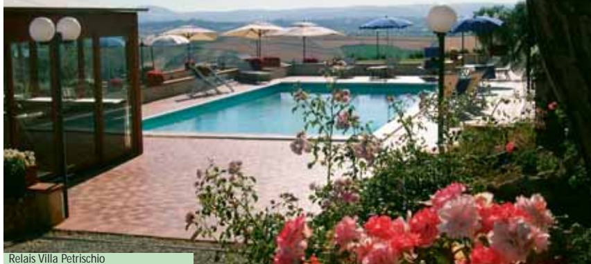
Relais Villa Petrischio