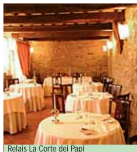
Relais La Corte dei Papi