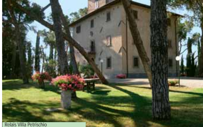
Relais Villa Petrischio