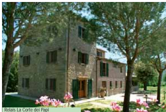
Relais La Corte dei Papi