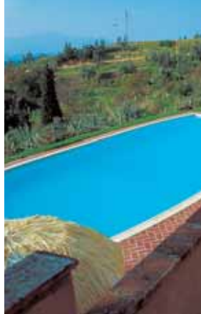
Agriturismo San Gervasio